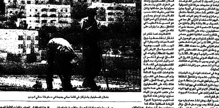
عمالان فلسطينيان يشركان في لكمة مياه جديدة في قلعة عمالي امويوم

80 لتراً من المياه كل فلسطيني، مقابل 300 لتر لكل مستوطن حكومة نتانياهو تحمل السلطة مسؤولية تقادم أزمة المياه في الضفة 80 لتراً من المياه كل فلسطيني، مقابل 300 لتر لكل مستوطن حكومة نتانياهو تحمل السلطة مسؤولية تقادم أزمة المياه في الضفة